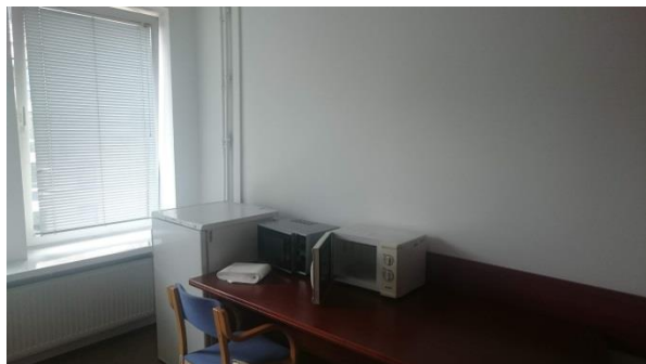
Pok. 558 – miejsce na zlewozmywak