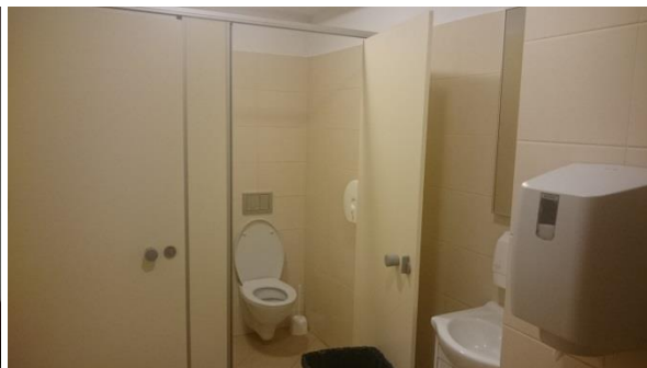
Toaleta – wygląd ogólny