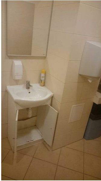
Szyb i umywalka